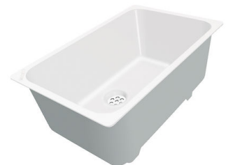
Weißer Wanne 8153 100